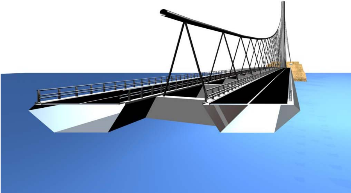
Figur 2: Brubane i hengespenn (Aas-Jakobsen)